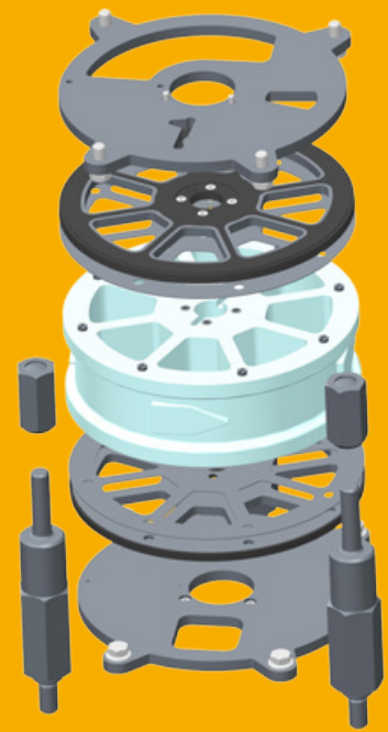
Stahldichtplattensatz für 2.5, 6 und 12 Lt.