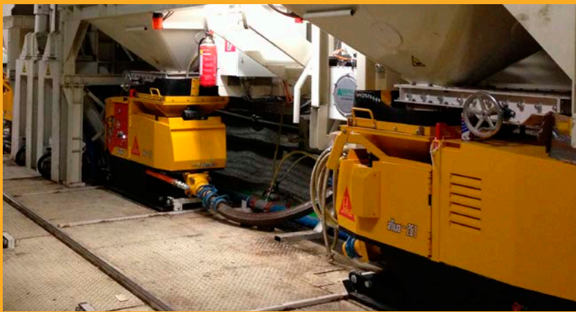
Perlkieshinterfüllanlage auf einer Tunnelbohrmaschine